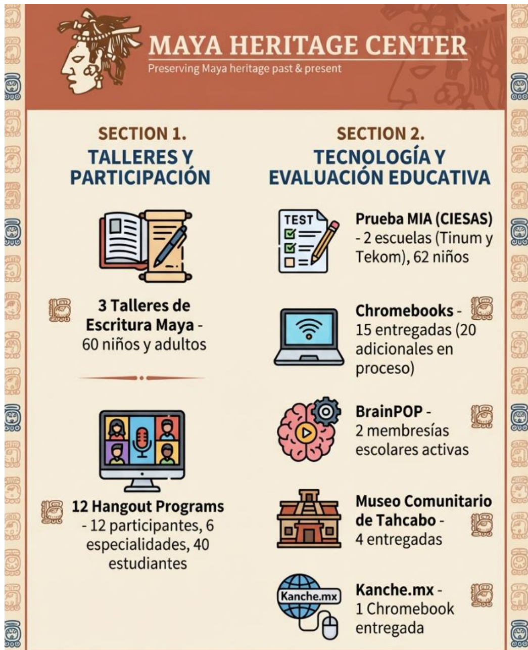
Infografía 3: Acceso a la excelencia académica